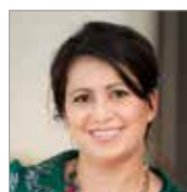
Özlem Cekic, Socialistisk Folkeparti MF