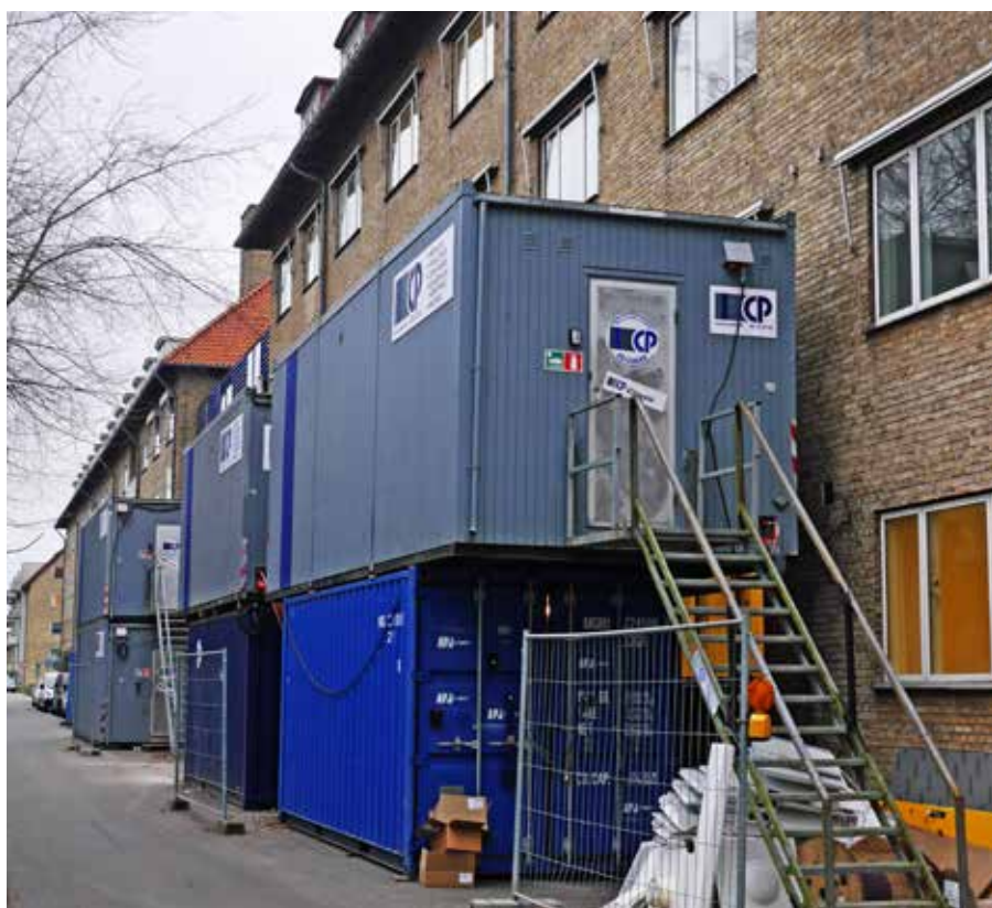
De polske malere overnattede i skurvognene, indtil fagforeningen startede sagen.

Denne forklaring købte fagforeningen ikke, og da der ikke kunne opnås enighed med Danske Malermestre om hvorvidt der var snydt, valgte fagforeningen at videreføre sagen til faglig voldgift. Sagen