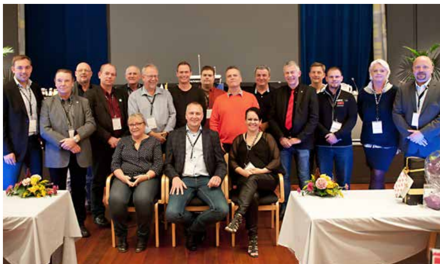
Den ny hovedbestyrelse.