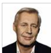
Henrik Dam Kristensen, Socialdemokraterne Beskæftigelsesminister.