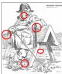
Vinderen fra sidste nummer: Karina Jespersen