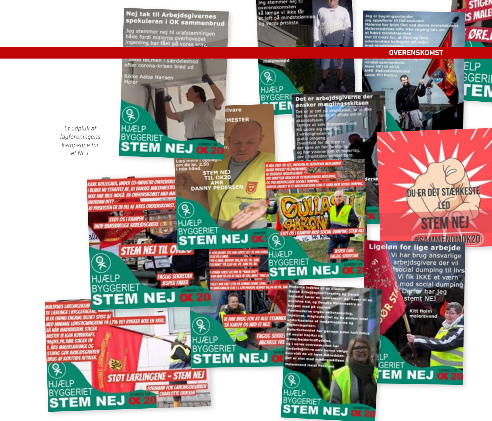
Et udpluk af fagforeningens kampagne for et NEJ.