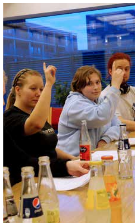
Afstemning og diskussion på generalforsamlingen

Vi siger stor og varm velkomst og tillykke med det flotte og gode initiativ! Vi er sikre på at vi vil få et rigtig godt samarbejde fremadrettet.