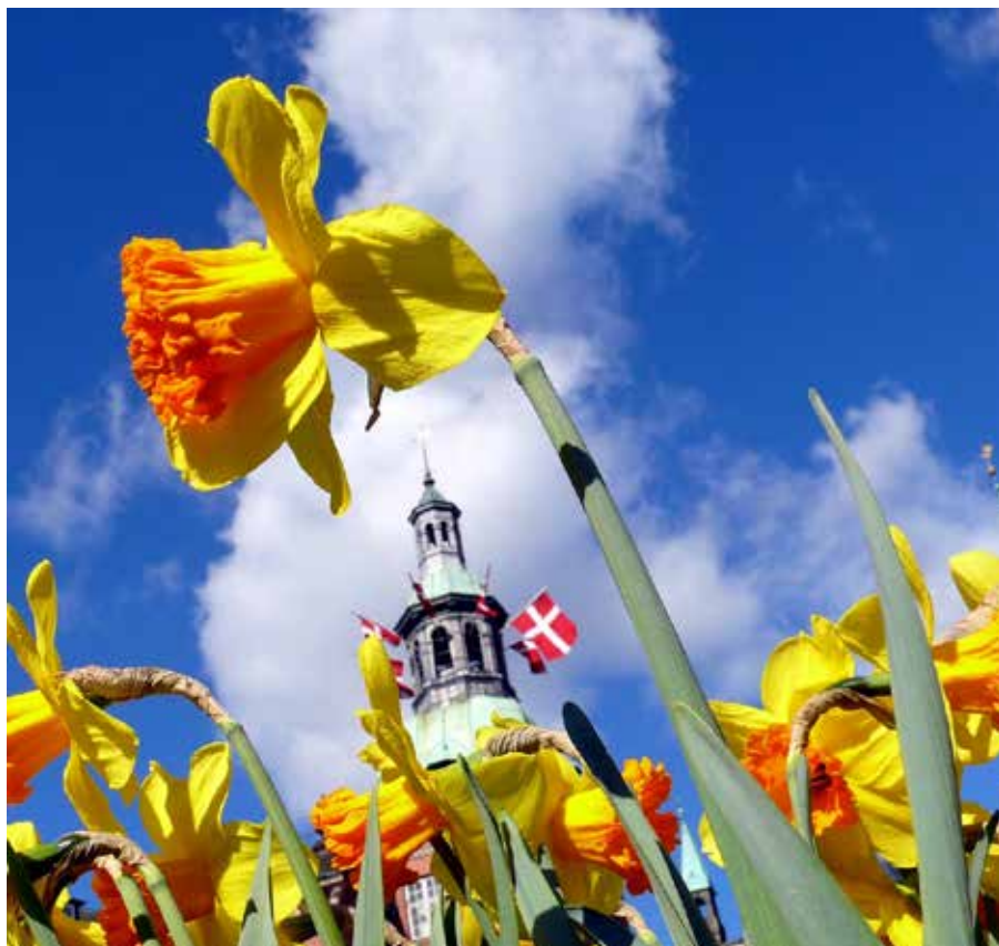
Påskeraten udgør 40 % af din opsparing

Mange lønbureauer tager ikke automatisk højde for stigninger i overenskomstens satser, og i de tilfælde skal arbejdsgiver selv holde øje med det og manuelt ændre satsen i lønsystemet. På de fleste lønsedler kan man kun se beløbet man har opsparet i lønperioden og hvor meget man i alt har opsparet i