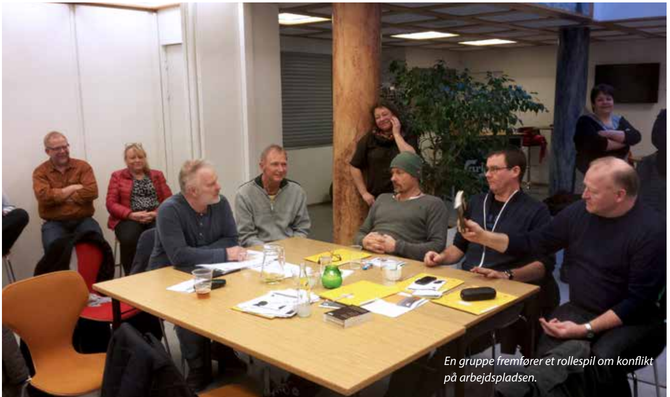
En gruppe fremfører et rollespil om konflikt på arbejdspladsen.