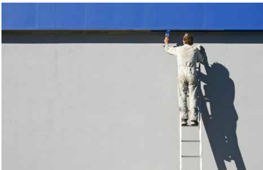
Bygningsmalerne er ærgerlige over at være blevet hængt ud for at være dovne.

Pt. er der en ledighed på 14,4% i Københavnsområdet for malere. Det er ganske enkelt forkert, og helt forkasteligt, at man udsender en sådan liste, uden at man tjekker med gruppens faglige organisationer. Listen stempler bygnings-