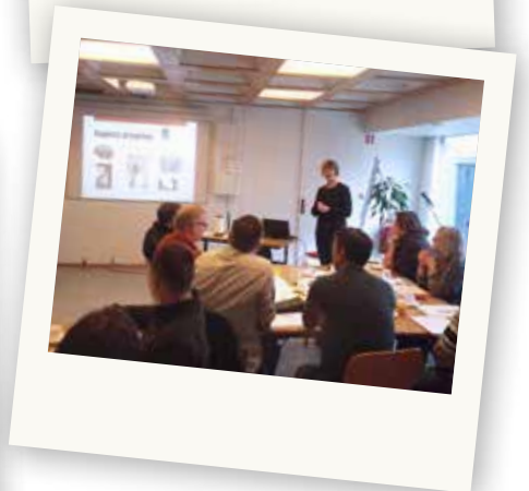
Dagen bød på indholdsrige oplæg og gode diskussioner