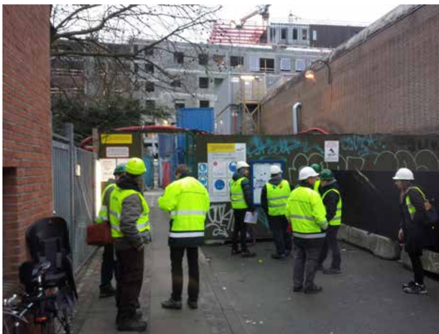
Her samles byggeforskere til dagens aktion

Efter den foreløbige vurdering af det indsamlede materiale, var det på de større steder, hvor byggeledelsen havde indstillet sig på, at der skal være styr på tingene, også lykkedes. De enkelte pladsrapporter skal nu gennemgås nærmere, og der var mange steder ting, der skal følges op på, for eksempel bedre sikring af adgangsveje, stilladser og adskillelse af kørende og gående, konstaterer formand for organiserings-