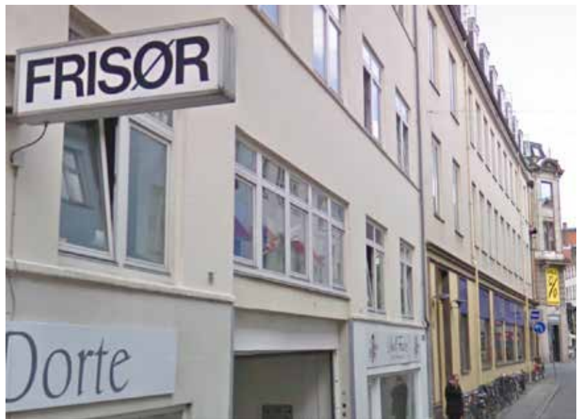
Ejendommen i Nygade

Fagforeningen forlangte derfor dokumentation for, at de polske malere var korrekt aflønnet med bl.a.