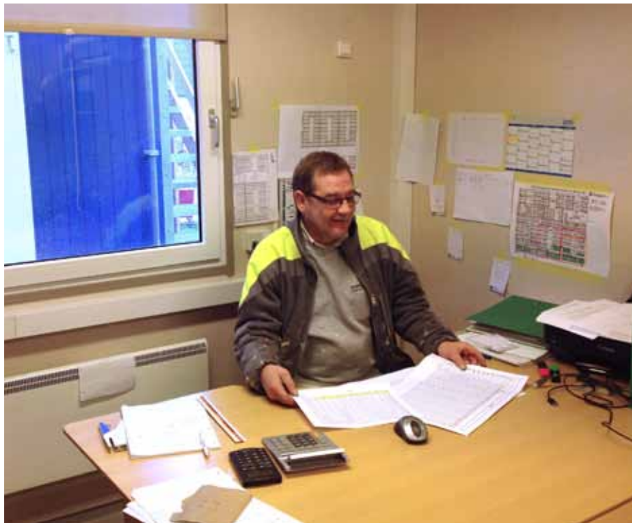
Bent bruger dagligt ca. en halv dag på formandsopgaver og nogle gange længere tid, for der er meget papir arbejde, når et så stort byggeri skal glide.

Renoveringen skal derfor leve op til lavenergiklasse 2015 ved passive tiltag, og boligerne bliver forberedt til lavenergiklasse 2020.