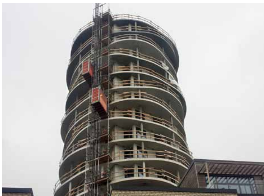
Malararbejdet på det store byggeri »Havneviggen« på Islands Brygge bliver nu kun udført af overenskomstdækket arbejdskraft.

»Vi er godt tilfredse med en fredelig afslutning på sagen, og at de fire polske malere nu er sikret løn- og ansættelsesvilkår, der følger overenskomsten«, udtaler fagforeningen.