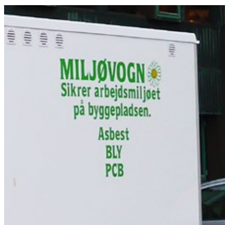
I gården var der demonstration af, hvordan en rigtig miljøvogn skal indrettes.

Spørgelysten var stor hele aftenen igennem og de forskellige indlæg skabte debat mellem svendene, der var mødt frem på Lygten.