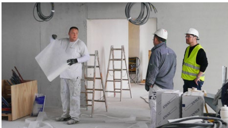
På arbejdspladserne fik vi en snak med svendene om arbejdsforholdene.

mand – også opmålt arbejde. Her var man godt tilfreds med arbejdsforholdene og indtjeningen på arbejdet. Pladsen vil køre frem til september 2016. ●