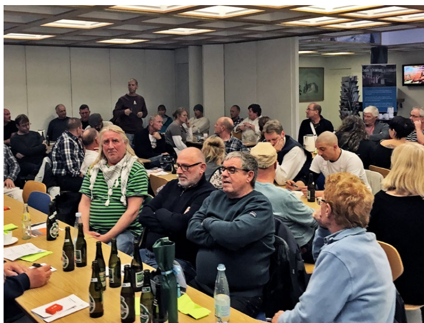
Mange medlemmer var mødt frem for at høre om, hvordan vores sundhedsordning fungerer.