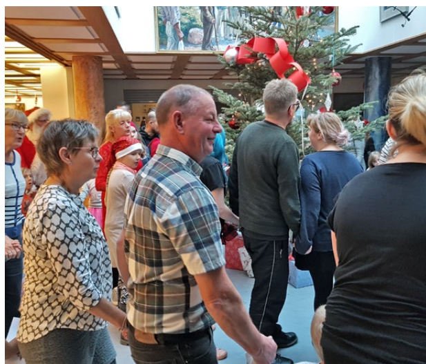
Nu' det jul igen og nu' det jul igen og ...