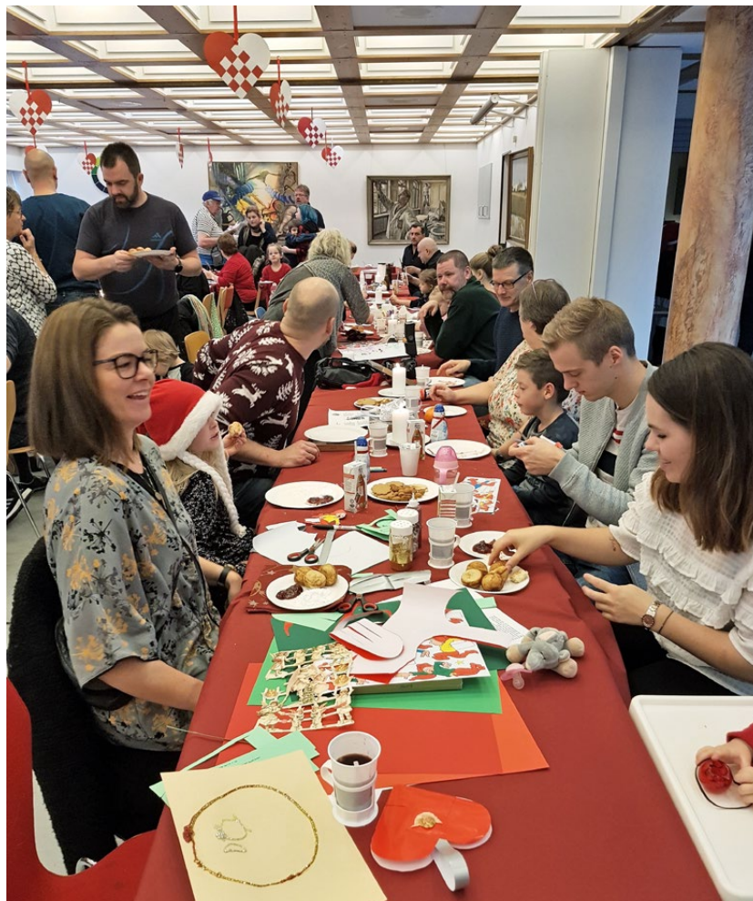
Der blev klippet og klisteret til den store guldmedalje.