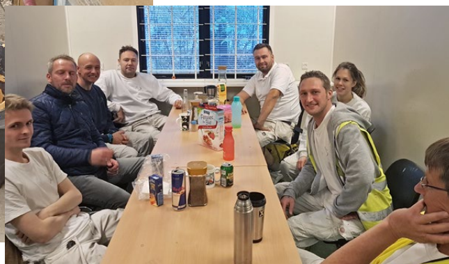
Klubformanden fra Petersen & Andersen og fagforeningen besøgte kollegaer på en arbejdsplads i Lyngby.

I skrivende stund har fagforeningen besøgt over 150 kollegaer og langt de fleste kan godt se fordelene ved at være ekstra godt kollektivt forsikret i tilfælde af ledighed. Det er besluttet af Malerforbundets hovedbestyrelse, at man indtræder direkte i ordningen, hvis man står som medlem af både fagforening og a-kasse inden den 31. januar. Efter den dato skal man optjene retten til lønsikringen gennem medlemskab af mindst et år. ●