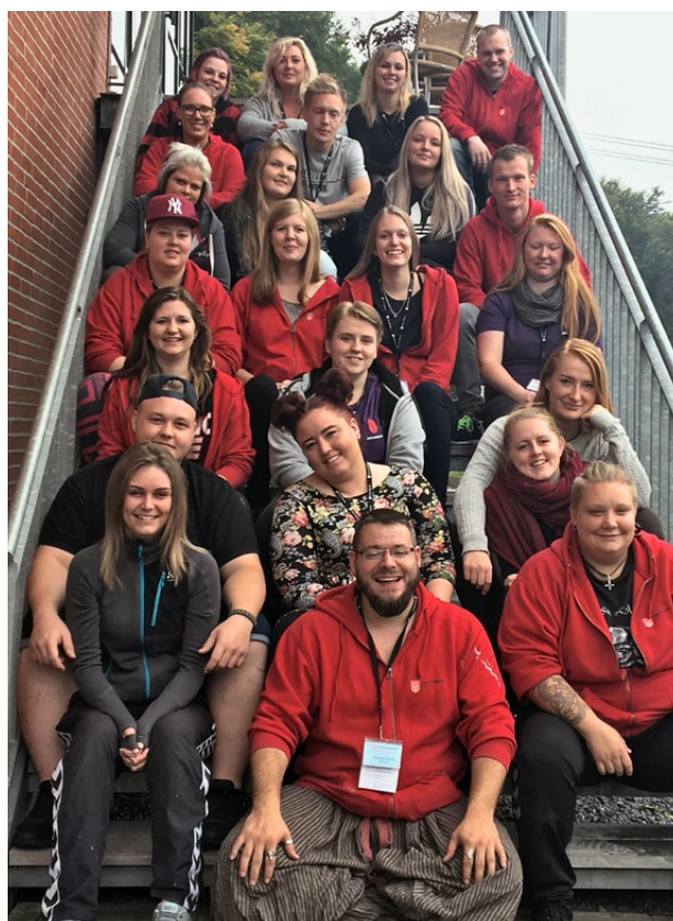
Den nye lærlingelandsledelse.

Næste kursus er til foråret 2018 i Odense. ●