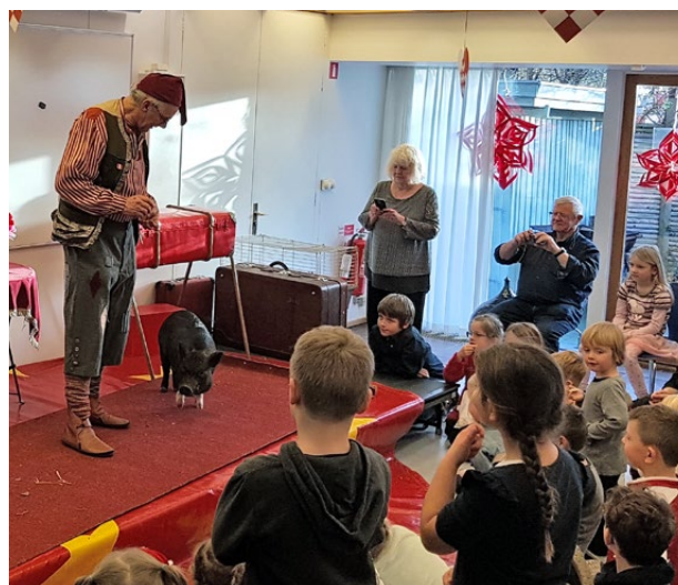
Morfar nisse underholdte med sin lille gris.