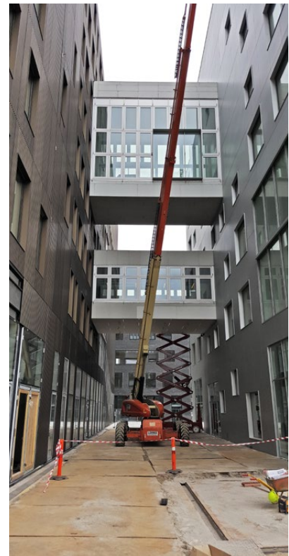
På enkelte af arbejdspladserne løb de udenlandske malere deres vej.

I alt blev der besøgt over 80 pladser på dagen. ●