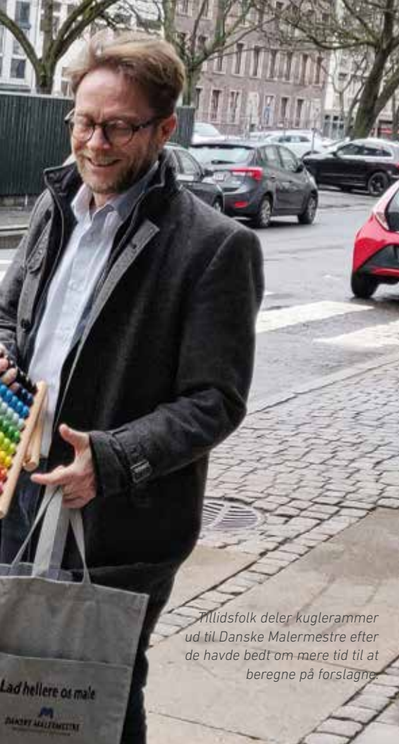
Tilidsfolk deler kuglerammer ud til Danske Malermestre efter de havde bedt om mere tid til at beregne på forslagene.

afsavn – da det er et kardinalpunkt for vores medlemmer, gik vi hver for sig, og der er ikke aftalt nye mødedage, så næste skridt bliver »Forligsen«.