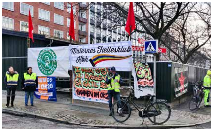
Malernes Fællesklub og lærlingeklubben var også mødt op med bannere og faner