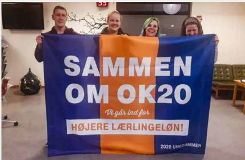
2019 var et meget aktivt år for Lærlingeklubben, med mange arrangementer og aktiviteter.