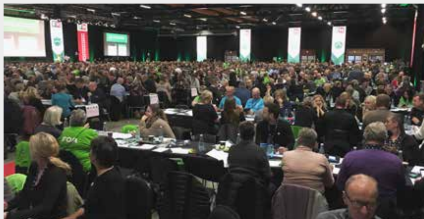
Den 8. januar blev arbejdsmiljørepræsentantens år 2019 skudt i gang i Odense, hvor 1350 arbejdsmiljørepræsentanter deltog.

Vi må desværre stadig konstatere at der er flere sager der ender med en fagretlig afgørelse på grund af