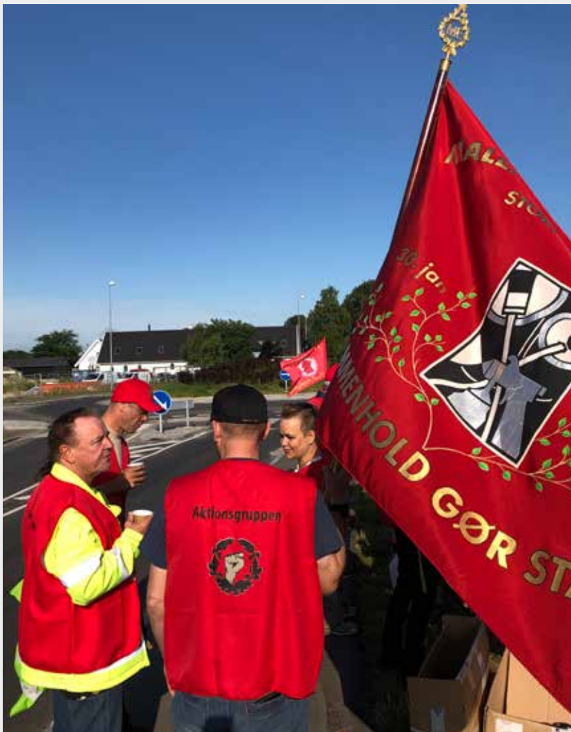
I starten af juli støttede Malerens Fagforening op om Rør og Blik og Aktionsgruppens happening mod byggefirmaet HM BoligByg.

med akkord. Vi har bl.a. oplevet, at der har været indgået aftaler om »slump akkorder« på flyttelejligheder, hvor de tilbudte priser lå på under halvdelen af hvad arbejdet kunne måles op til ifølge prislister. Sådanne aftaler må under ingen omstændigheder finde sted og den pågældende arbejdsgiver har også måtte betale differencen til medlemmerne samt det fulde opmålingsgebyr. Der har også været en stigning i de sager hvor medlemmer er af den opfattelse, at de arbejder på timeløn og hvor arbejdsgiveren mener at arbejdet udføres på akkord.