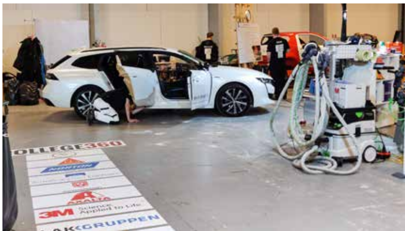
Der blev arbejdet hårdt på at finpudse resultatet i Bella Center.

DM i Skills giver de unge chancen for at vise deres talenter. Det er desuden med til at skærpe deres faglige niveau og vise omverdenen – heriblandt grundskoleelever – erhvervsuddannelsernes mangeartede og spændende muligheder.