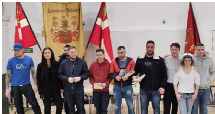
Det nyudklækkede hold af bygningsmalere modtager deres svendebreve.

Ugen før den 5. december, kunne der siges Tillykke til 17 nyudlærte Skilteteknikere. Alle havde lagt et stort stykke arbejde i deres aflevering, med flotte gennemsnit til følge. 8 elever bestod med ros.