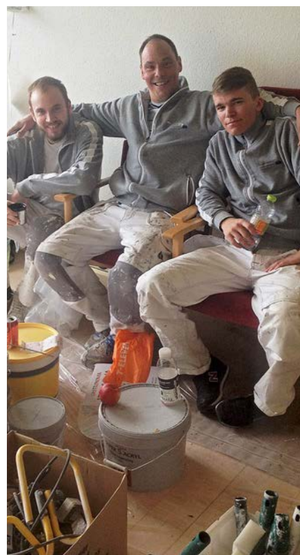
To svende og en lærling afgav deres stemme på byggepladsen

Vi er som afdeling ikke i tvivl om at det er en model som med lidt finjustering, også fremadrettet er en brugbar måde og et godt tilbud for vores medlemmer.