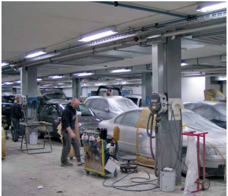
Vognmalerbranchen ser lyst på fremtiden, viser fagforeningens rundtur til værkstederne.

For kurser, hvor MALKOM yder tilskud til løn, dækkes lønomkostningen op til 150,- kr. i timen.