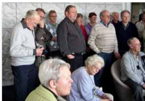
Seniorklubben har gentagne gange besøgt høreapparatvirksomheden Oticon. Billedet her til venstre er fra et besøg i april 2010.

PS. Husk: Har du som pensionist meldt dig ud af malerforbundet, kan du ikke blive medlem igen!