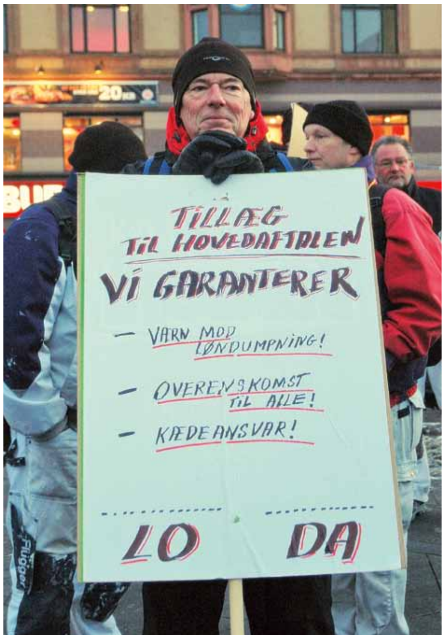
Fra OK-aktion på Rådhuspladsen den 9. februar sammen med de andre byggefag

Alle overenskomstområder bliver sammenkædet i et samlet mæglingforslag fra Forligsmanden. Ved redaktionens slutning var afstemningsperioden endnu ikke fastsat. Alle medlemmer vil få tilsendt overenskomstforslaget, der indeholder en række protokollater, samt oplysning om hvordan der kan stemmes. Som noget nyt vil der i år kunne stemmes bl.a. via SMS.