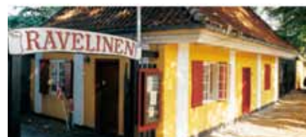
Ravelinen ligger lige ved siden af Christianshavn Metro station