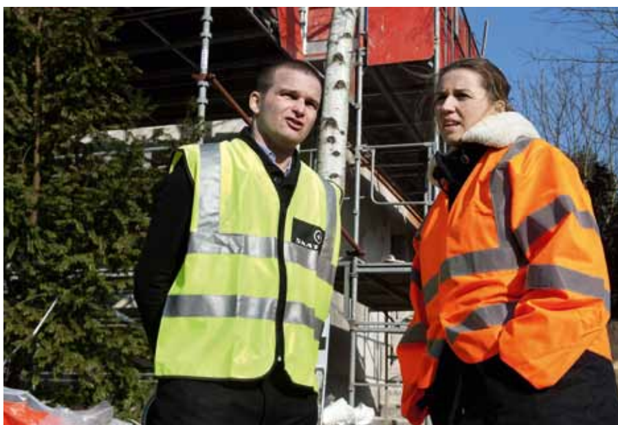
Beskæftigelsesminister Mette Frederiksen (S) og Skatteminister Thor Möger Pedersen (SF) deltog i aktionsdagen mod social dumping.

Mens Arbejdstilsynet tjekkede RUT-registrering og arbejdsmiljø, var SKATs fokus på bl.a. moms- og skatteforhold. Her har