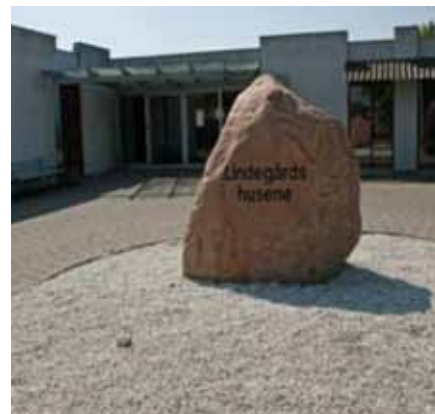
Malerne, vi mødte, er nu 100 procent organiserede.

F.eks. besøgte vi Center Lindegården, hvor tillidsmanden er fra Metal, men desværre er der ingen fælles værkstedsklub.