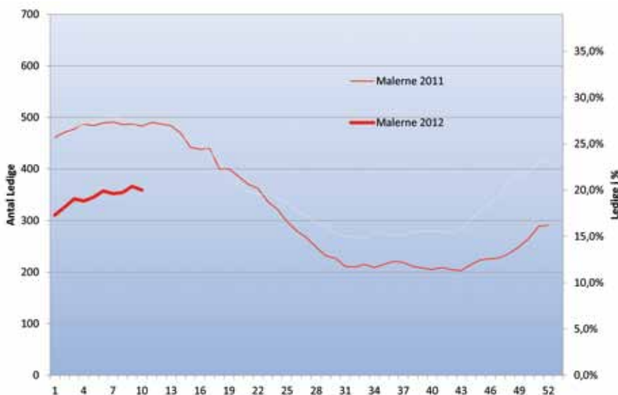
Ledige Malere i København