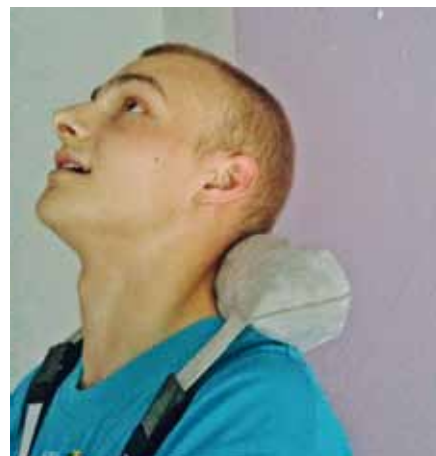
Nack Mollis er et unikt produkt til aflastning af nakken ved vedvarende arbejde når blikket er rettet opad.

Modtager medlemmet kontanthjælp på tidspunktet for tildelingen af fleksjobbet, vil man fortsætte med at modtage kontanthjælp.