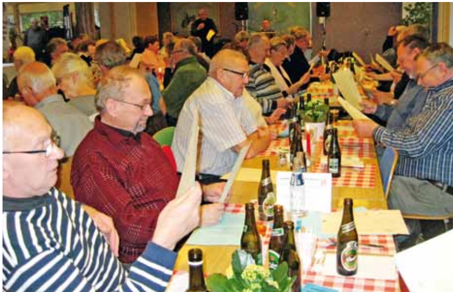
Da redaktionen sluttede den 8. december, får vi ikke omtalt alle julefrokosterne, men en del af de fotos, der bliver taget, vil blive lagt ud på nettet på www.malerneshus.dk under senior.

I seniorudvalget glæder vi os til at se jer igen i 2012.