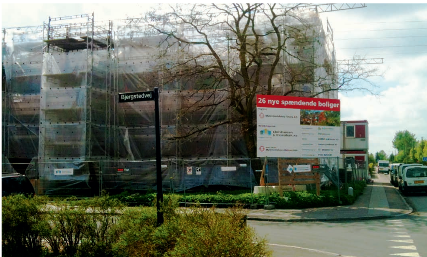
Denne plads i Brønshøj var en blandt de 94 pladser, som de 75 tillidsfolk besøgte den 11. maj.

ske malere – og dette på trods af, at der på samme tidspunkt var 400 arbejdsløse malere.