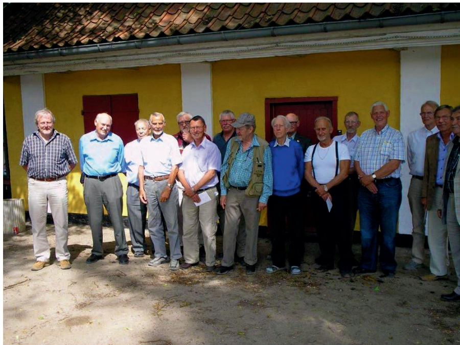
Jubilarerne foran restaurant Ravelinen på Christianshavn.

Malernes fagforening ønsker de 16 jubilarerne stort tillykke.