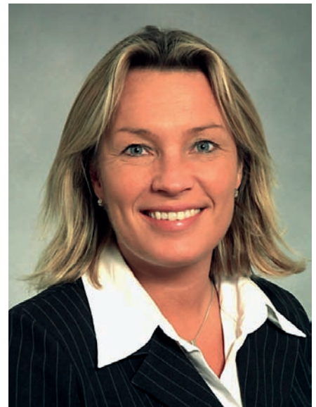
Udenrigsminister Lene Espersen undergraver sine egne kernevælgere.

Det er jo meget uheldigt, at regeringen officielt giver udtryk for, at man er tilhængere af den danske model, når virkeligheden er, at medlemmer af regeringen medvirker til at undergrave selv samme