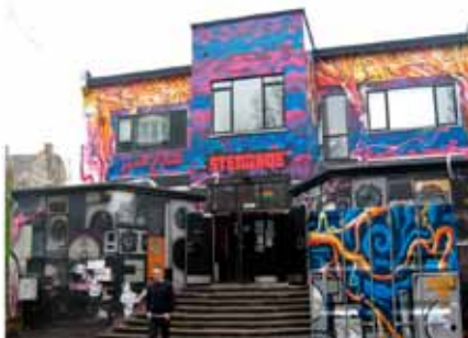
Vi blev godt modtaget i Stengade 30, og en repræsentant for huset viste os rundt og fortalte, hvad huset i dag bruges til.