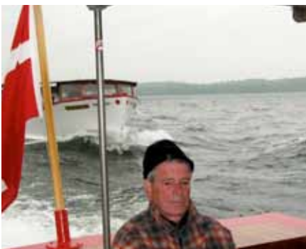
100 medlemmer deltog i en hyggelig sejltur.