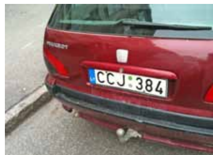
VG firmabil på Mønstersvej