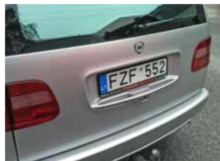
VG firmabil på Toftekærvej