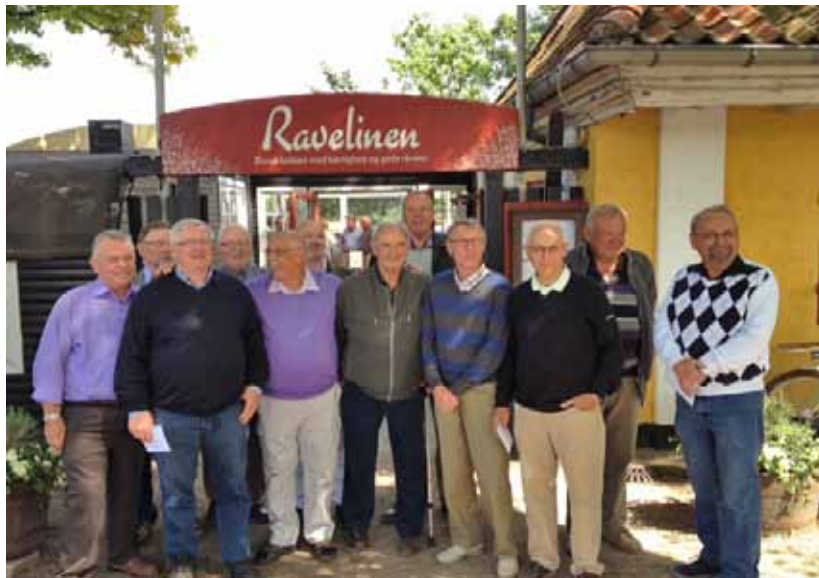
De glade gulddrenge stillede op til foto foran Ravelinen