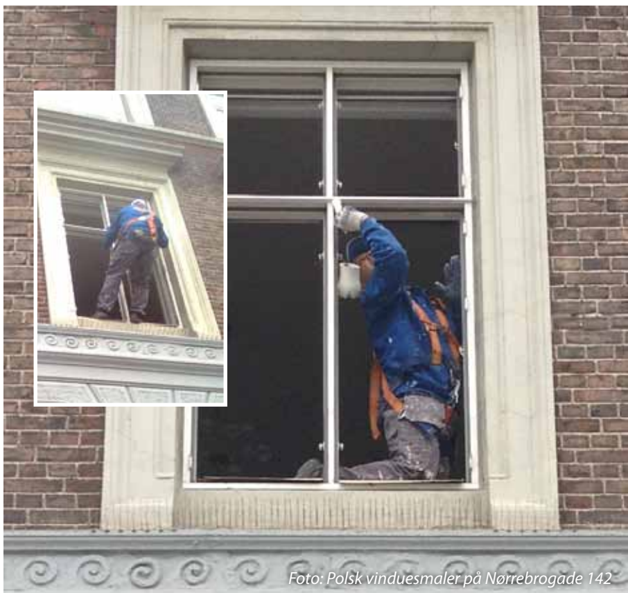
Foto: Polsk vinduesmaler på Nørrebrogade 142