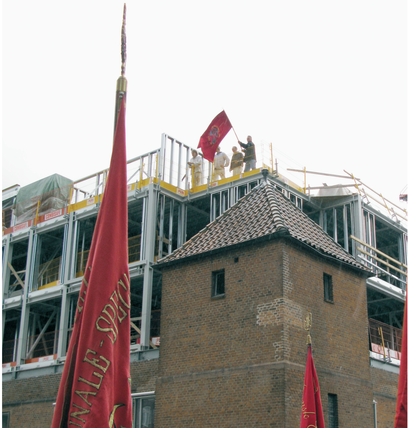
Rød fane over „Mønten“.

Bygherren bag byggeprojektet „Mønten“ i København har opsagt aftalen med det polske byggefirma, som anklages for grov underbetaling, men ikke vil tegne overenskomst.