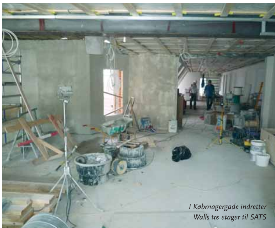
I Købmagergade indretter Walls tre etager til SATS

Børsnoterede Walls med underbetalte polske i Købmagergade 48 – nu er der faglig sag