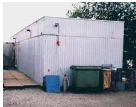
I denne lukkede container indkvarterede Henryk Thomsen 16 polske arbejdere, da de arbejdede for ham i 2005.

Malernes fagforening finder den fremlagte dokumentation af arbejderens indkvarteringsforhold rystende.