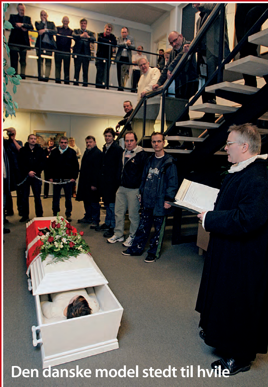
Den danske model stedt til hvile

Se facts om malerfagets overenskomstforslag på side 3