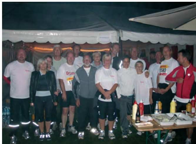
Malernes fagforening deltagere ved sidste års DHL Stafet.

Deltagelse i DHL Stafetten koster kun kr. 75,00 Heri er indeholdt betaling for forplejning + t- shirt.