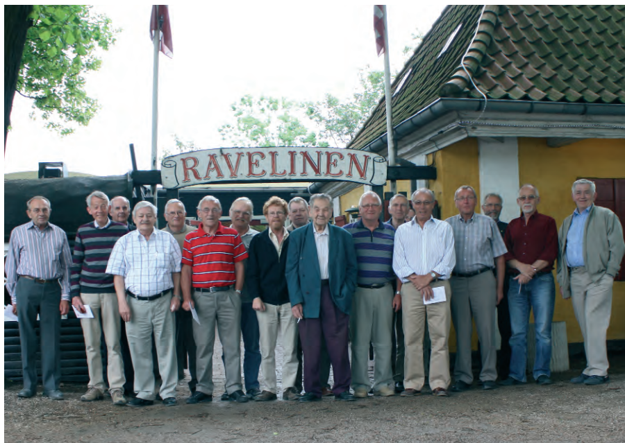
Jubilarene foran Restaurant Ravelinen, hvor fagforeningens årlige skovtur blev holdt.