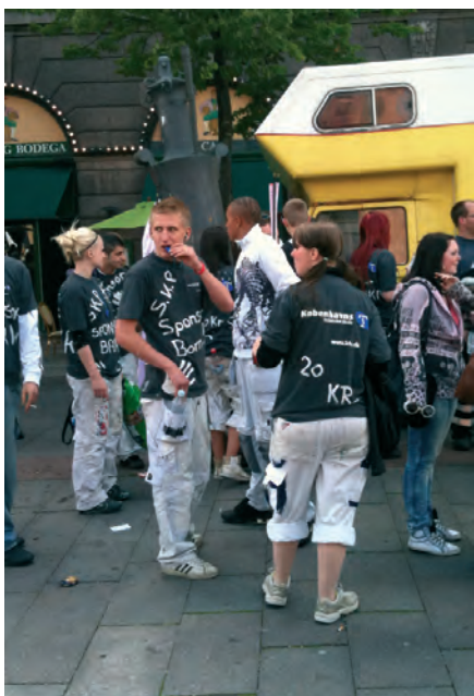
SKP-lærlinge deltog i den store protest på Slotspladsen imod regeringens nedskæringer på blandt andet SKP-lønnen.