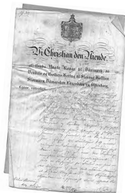
Foreningen blev stiftet ved en kongelig bevilling fra Christian den niende i 1854.