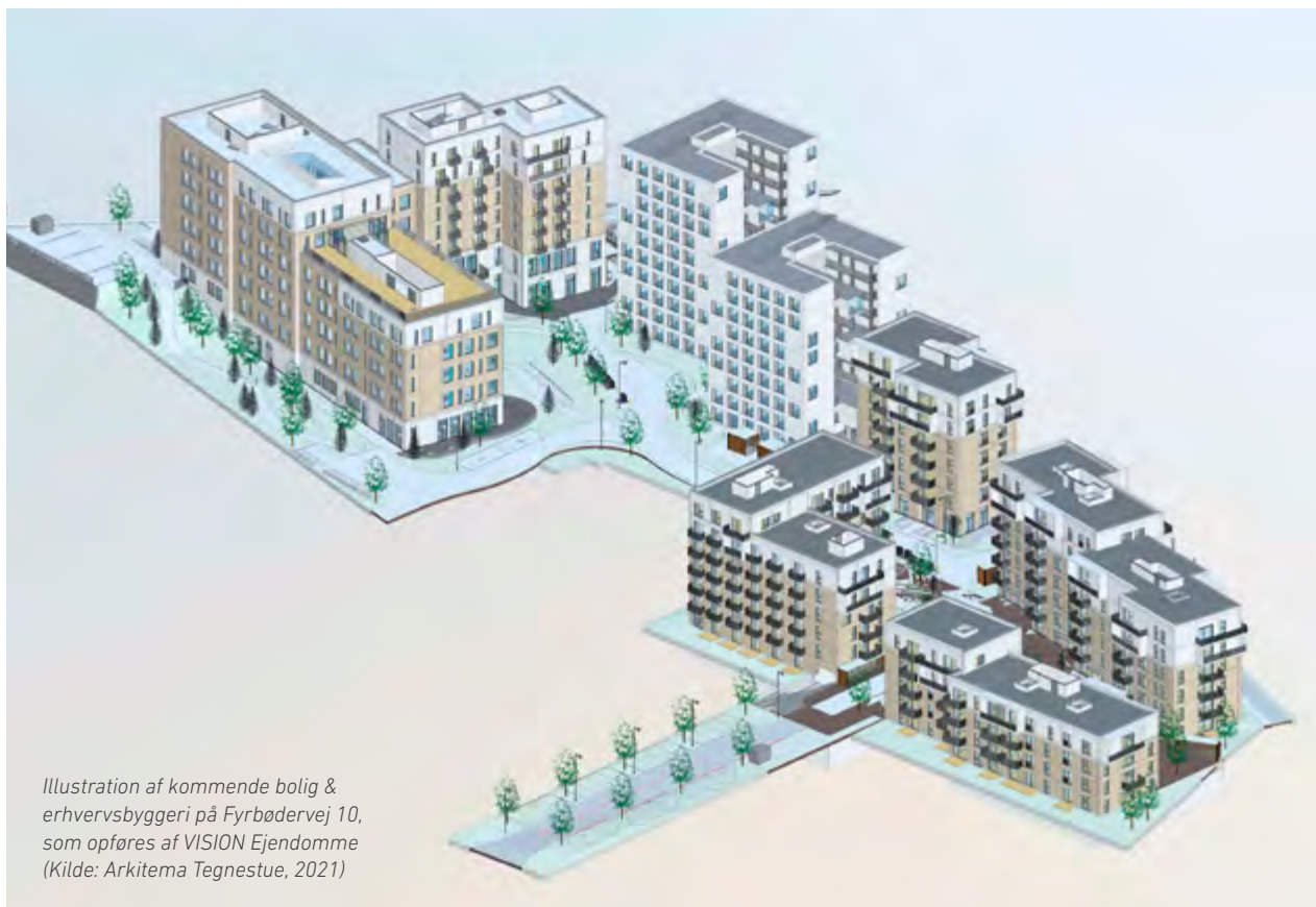
Illustration af kommende bolig & erhvervsbyggeri på Fyrbødervej 10, som opføres af VISION Ejendomme

Lygten får nye naboer på den gamle DSB-grund, og fagforeningens bestyrelse er gået aktivt ind i projektet.