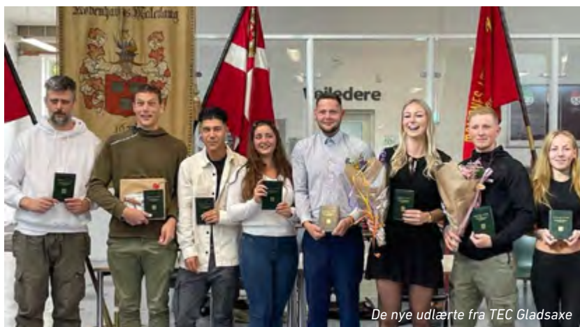
De nye udlærte fra TEC Gladsaxe

Autolakere aflægger svendepøver på College 360 i Silkeborg. ●