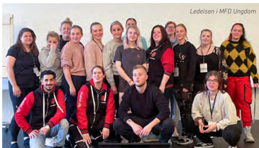
Ledelsen i MFD Ungdom

Efterårskurset for eleverne blev afholdt fra den 21. til den 23. oktober på Vingsted konferencecenter nær Vejle. Det er også her Malerforbundets lærlingeorganisation MFD Ungdom afholder deres årsmøde, hvor de vælger Formand, Næstformand, sekretær og bestyrelsesmedlemmer. Tillykke til den nye bestyrelse og tak for indsatsen til den gamle. ●